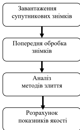
Рис. 1. Схема алгоритму.

1. Попередня обробка знімка. На цьому етапі було виконано масштабування БЗ до розмірів панхроматичного зображення, та гістограмну еквалізацію багатоспектрального зображення. Це дозволило відкоригувати первинні зображення, вирівнявши інтегральні площі ділянок з різною яскравістю, запропонованим алгоритмом у роботі [14].