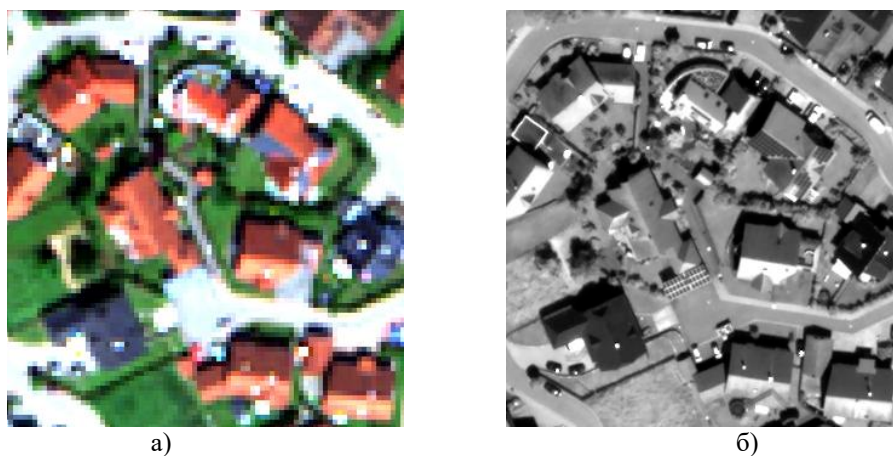
Рис. 2 Еталонні знімки, отримані супутником WorldView-2: а) багатоканальне зображення; б) панхроматичне зображення.

де F_i – це i -й канал в зображенні після методу злиття, MS – БЗ, P – ПЗ, MS_{i\uparrow} – i -й канал зображення MS після масштабування до розмірів P , * – оператор згортки, g – високочастотний фільтр.