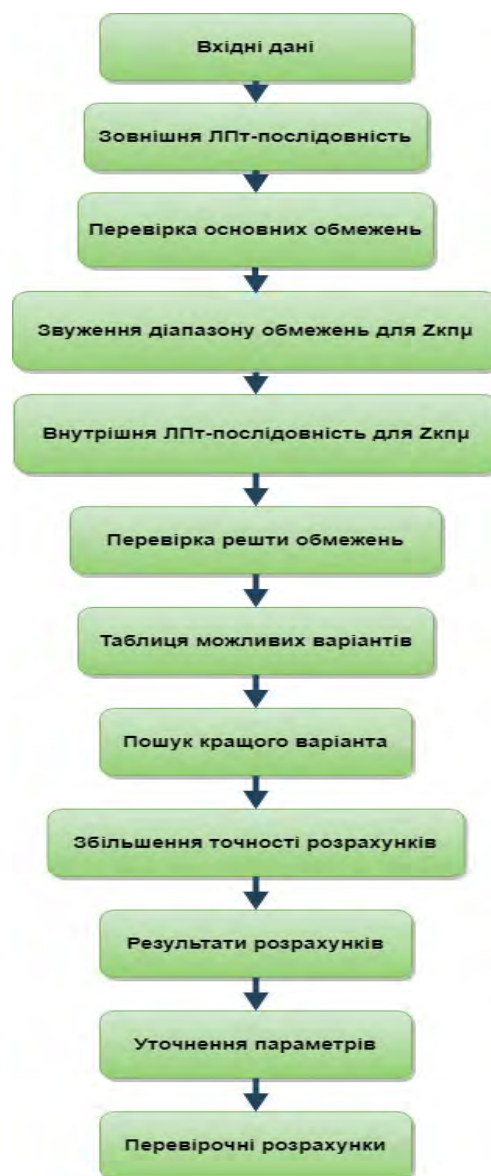
Рис. 2. Схема алгоритму оптимального проектування трансмісії транспортера-тягача МТ-ЛБ.