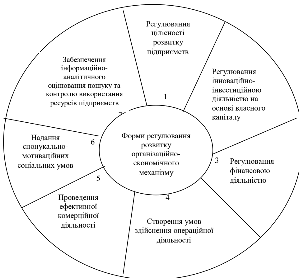
Рис. 2. Основні складові організаційно-економічного регулювання діяльності та розвитку плодово-овочевого консервного виробництва

Наші дослідження дозволяють утвердитись у думці про те, що шлях розвитку плодово-овочевого консервного виробництва має пролягати через створення інтегрованих агропромислових виробничих структур. До переваг міжгалузевих інтегрованих структур, стосовно плодово-овочеконсервного виробництва, слід віднести наступні: